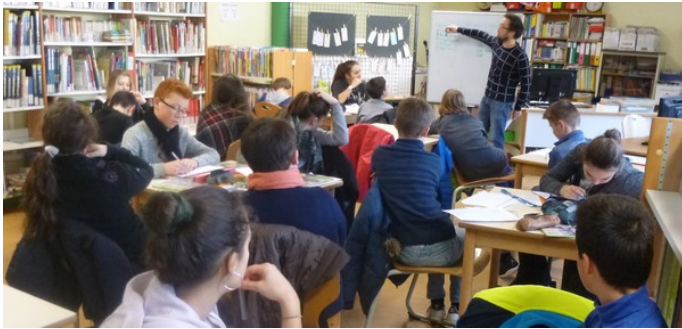
L'animateur radio présente Plum'FM.

Une première rencontre a eu lieu le 5 janvier au collège au cours de laquelle les élèves ont découvert le monde de la radio.