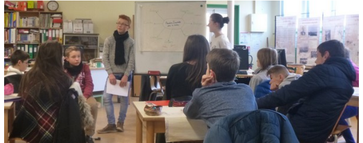
Les élèves présentent le plan de leur chronique devant la classe.

Au cours de la deuxième rencontre avec l'animateur radio le 26 janvier, les élèves ont commencé à élaborer le plan de leur chronique radio.