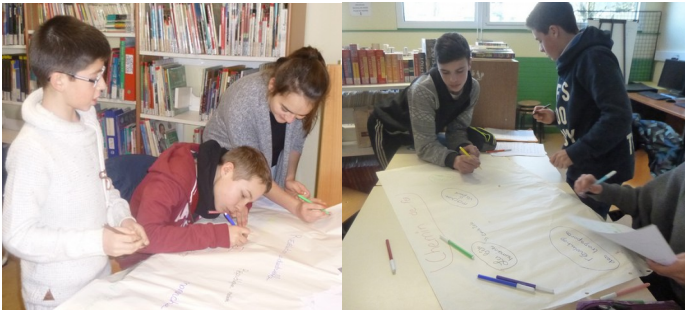
Les élèves classent leurs informations.

Les élèves travaillent en français et en histoire, en lien avec le CDI.